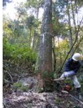
施主と一緒に木の伐採見学。太鼓丸太に使用します。