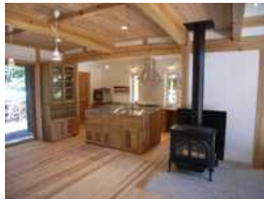
広葉樹の家具、巻きストーブ