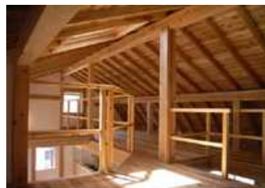
吹き抜けとつながった広いロフト