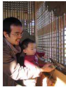
土壁塗りワークショップ