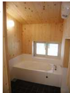
コルクタイルの床と桧の浴室