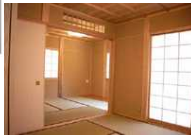
無農薬い草を使用した畳