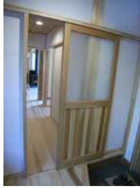
鏡板にすべて違う樹種を使った色々ドア。