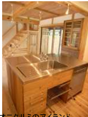
オニクルミのアイランドキッチン