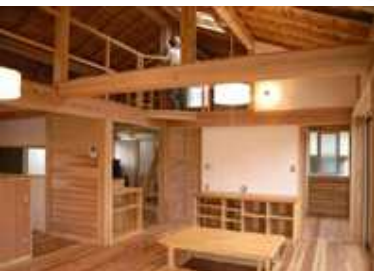
東京の木のみ使用した家。