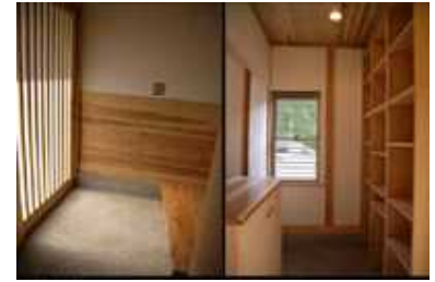
広い収納スペースの玄関兼土間